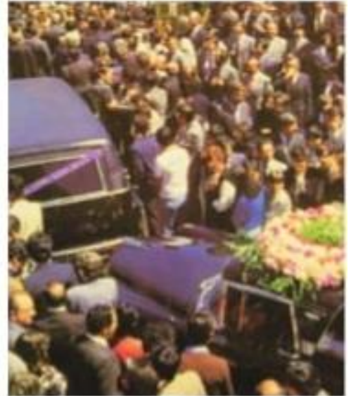
Entierro de Guillermo Cano Isaza.