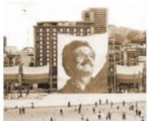
El candidato presidencial Luis Carlos Galán fue asesinado por el cartel de la droga en 1989.

Para finalizar en la siguiente imagen encuentras cada uno de los presidentes de este periodo y sus aportes